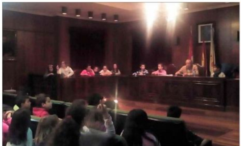
Los escolares ocuparon tanto el espacio para el público como los sillones de la Corporación. HOS

la mayoría, aunque en algún caso le pusieran en un brete. Alumnos de los colegios Diego Lainez y Calasancio acudieron al salón de plenos y ocuparon las butacas del público y también de la corporación, en una «clase general de cómo funciona el Ayuntamiento y qué se hace en él». Muchas propuestas dejaron bien claro cuáles son las inquietudes de los más pequeños, «que propusieron un carril bici hasta la puerta del colegio» y, por supuesto, la dotación de más columpios y campos de fútbol.